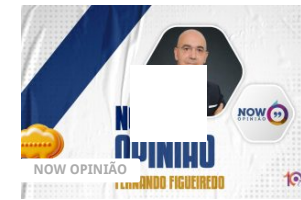
Now Opinião Fernando Figueiredo – Guerra na Ucrânia e no Médio Oriente