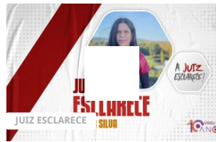
A Juiz Esclarece – Providência destinada à resolução de diferendo entre os pais