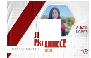
A Juiz Esclarece – Alteração do regime de regulação das responsabilidades parentais